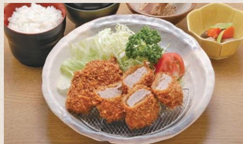
ヒレかつ定食 1,400円 (税込1,540円)