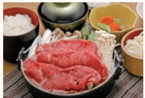
すき焼き定食 1,700円 (税込1,870円)