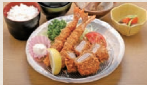
海老ひれかつ定食 1,800円 (税込1,980円)