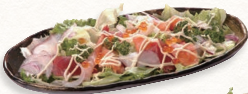
海鮮サラダ カルパッチョ風