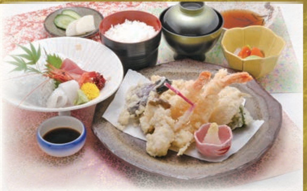
天ぷら刺身定食 1,900円 (税込2,090円)