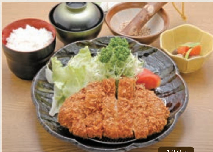
130g ローズかつ定食 1,200円 (税込1,320円)

さつまいも豚はその名の通りさつまいもを食べて育った豚のことです。トウモロコシ主体の飼料で育った豚よりも出荷まで1〜2週間長くかかるため、肉質が豚の体内で良質な脂にゆっくりと変わります。そのため脂身はとろけるように甘く、旨みやコクをとり込んだ赤身はジューシーで柔らかいです。