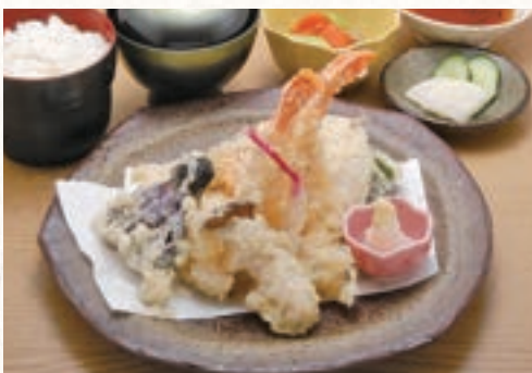
天ぷら定食 1,450円 (税込1,595円)