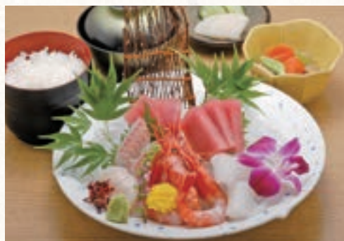
刺身定食 1,700円 (税込1,870円)